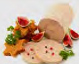
Du foie gras