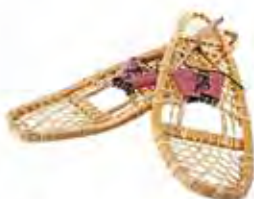
5 Des raquettes