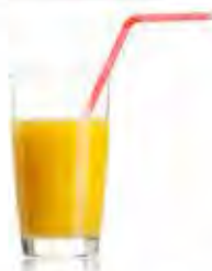
Du jus d'orange