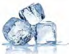
3 Des glaçons