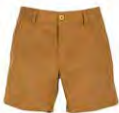
1 Un short