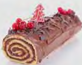
4 Une bûche