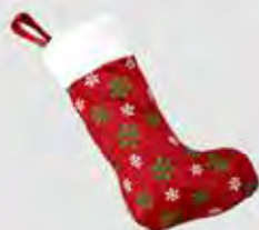
2 Une chaussette