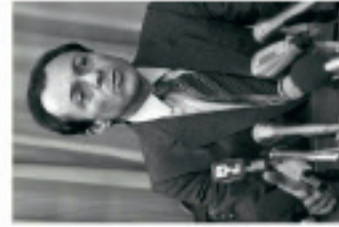
Nomination de Michel Rocard