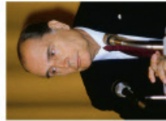
Investiture de François Mitterrand