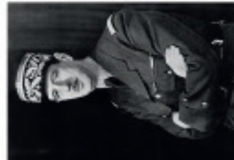
Investiture de Charles de Gaulle