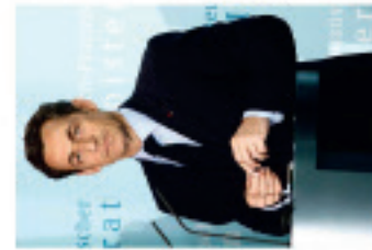
Investiture de Nicolas Sarkozy