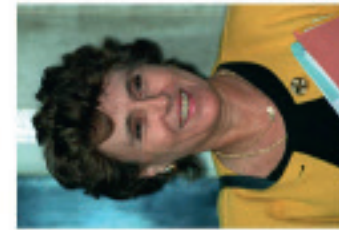
Nomination d'Édith Cresson