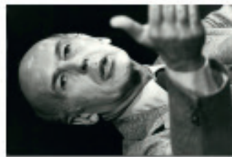
Investiture de Valéry Giscard d'Estaing