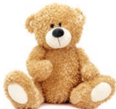
3 Un nounours