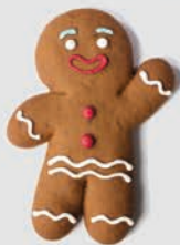
2 Pain d'épice